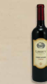
Liberty School Cabernet Sauvignon