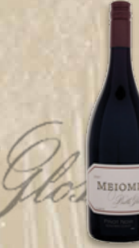
Belle Glos Meiomi Pinot Noir