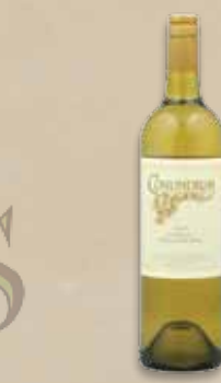
Conundrum White Table Wines