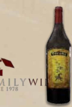
Terana Cabernet Sauvignon / Syrah