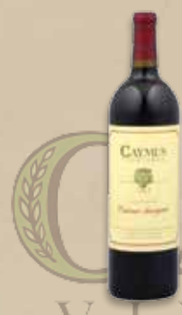
Caymus Napa Valley Cabernet Sauvignon