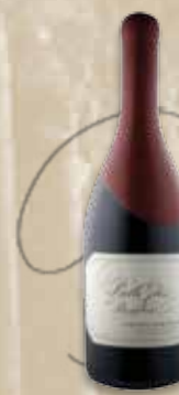
Belle Glos Clark & Telephone